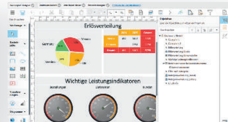
Berichte sind von Entwicklern und Anwendern über den frei verteilbaren Designer bearbeitbar.